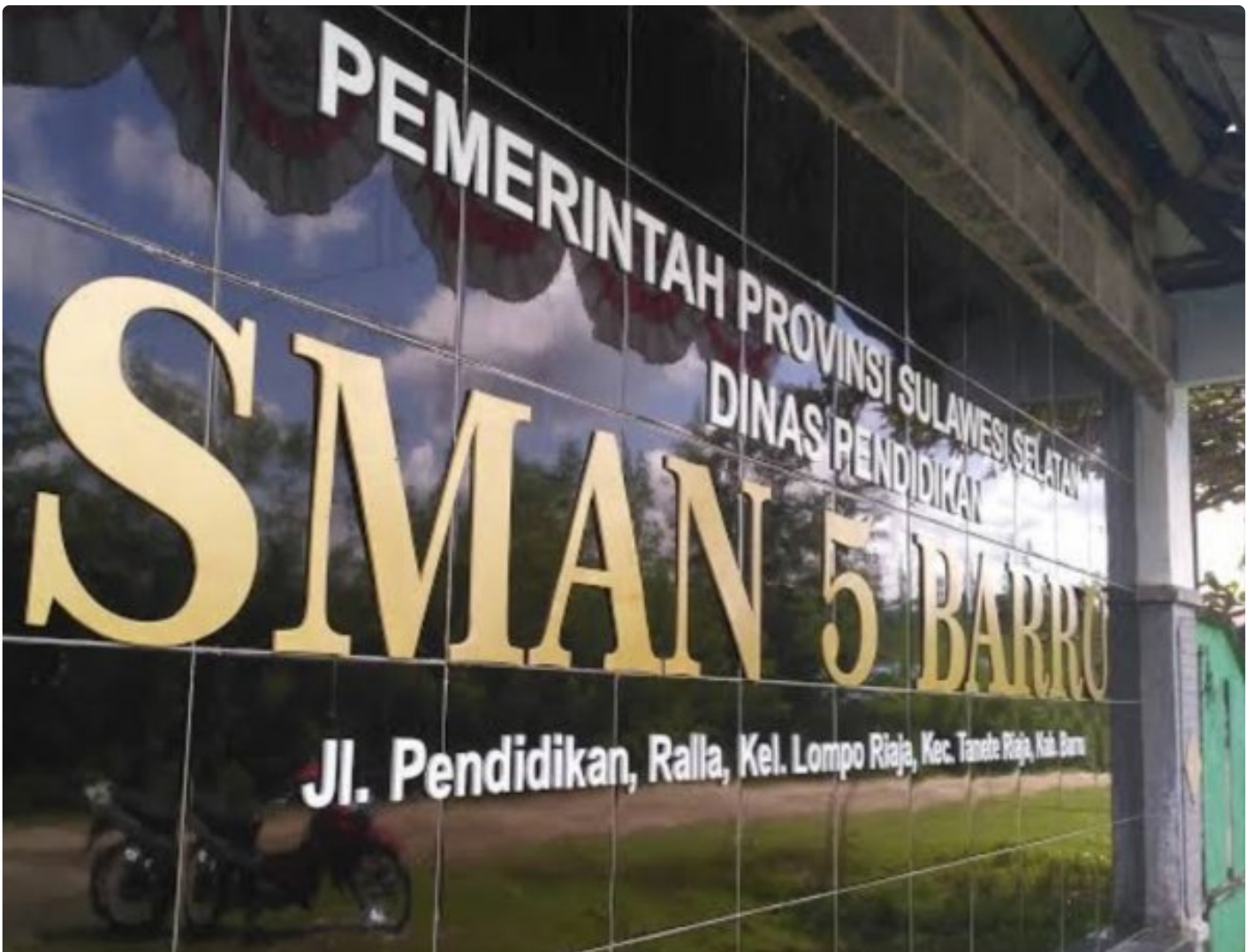
Sekolah Menengah Atas Negeri (SMAN) 5 Barru di kelurahan Lompo Riaja, Kecamatan Tanete Riaja, kabupaten Barru provinsi Sulawesi Selatan

BARRU- Siswa Sekolah Menengah Atas Negeri (SMAN) 5 Barru di kelurahan Lompo Riaja, Kecamatan Tanete Riaja, kabupaten Barru provinsi Sulawesi